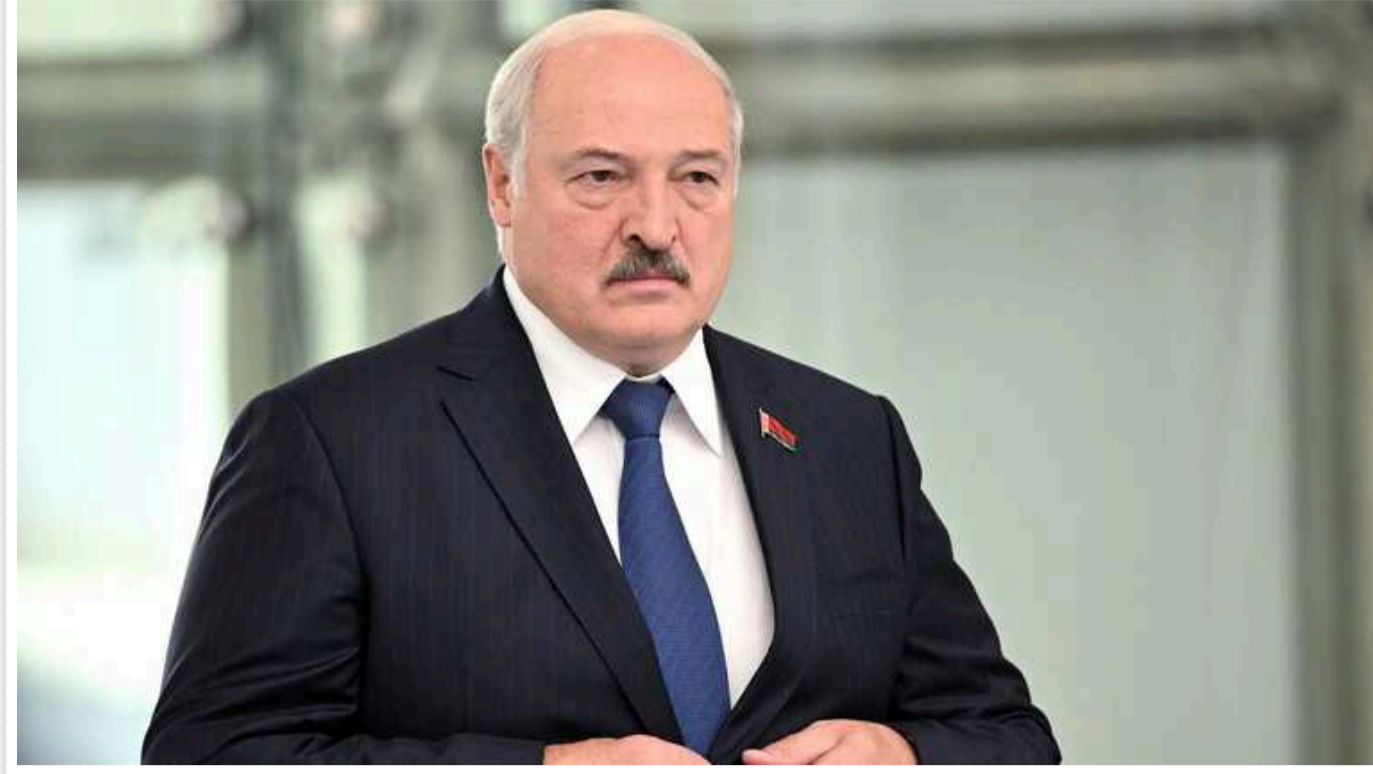
У Білорусі посилили покарання для ухиялнтів та дозволили службу ув'язненим

Самопроголошений президент Білорусі Олександр Лукашенко 3 квітня підписав закон, який передбачає СМС-повідстки, посилені покарання для ухиялнтів і можливість служби в армії для судимих та ув'язнених колоній.