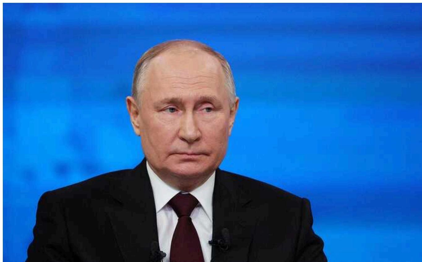
Кремль відкрито погрожував Вірменії та Фінляндії, – ISW

Країна-терористка Росія відкрито висунула погрози Вірменії через зв'язки Єревана із Заходом після нездатності РФ запобігти втраті Вірменією Нагірного Карабаху у вересні 2023 року. У Кремлі видали, що Захід намагається "втягнути Південний Кавказ у геополітичну конфронтацію".