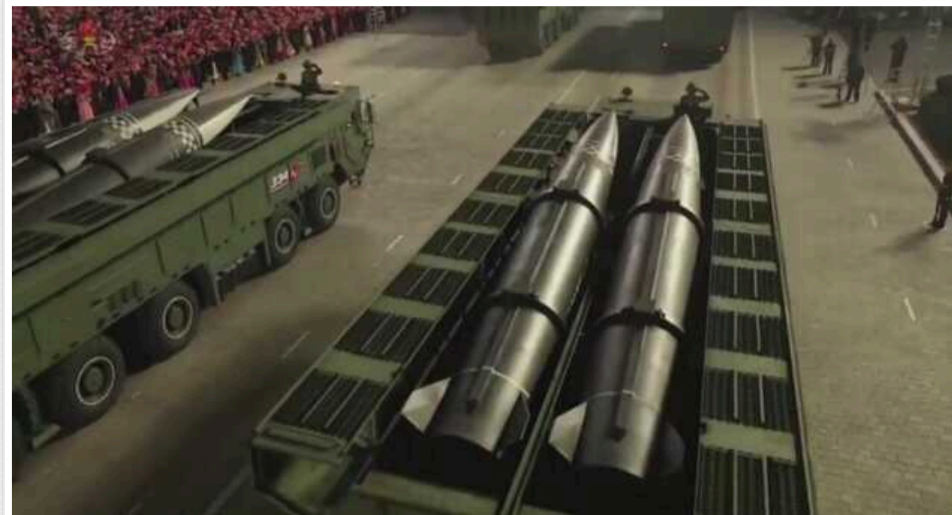
Bloomberg: Північна Корея використовує Україну, як полігон для випробування своїх балістичних ракет

Північна Корея отримала рідкісний шанс випробувати свою зброю в реальних бойових умовах в Україні і може скористатися цим для покращення її характеристик.