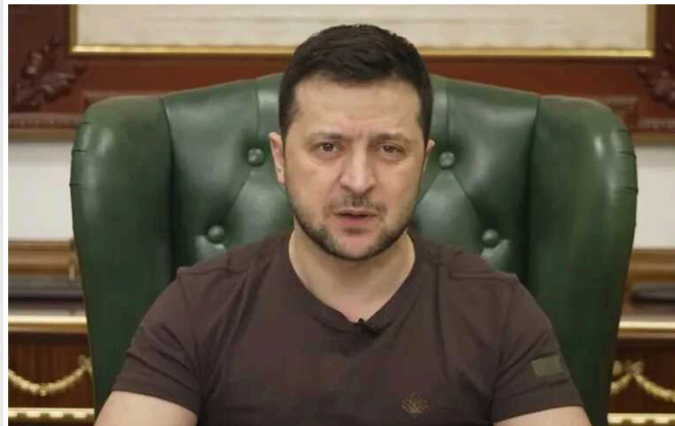
Зеленський пообіцяв відповісти агресору на кожен обстріл: "Росія заслуговує на те, щоб програти"

Україна зробить все можливе і неможливе, щоб світ бачив героїзм українців, які захищають свою державу та відновлюють життя попри все. Саме про це говорив президент нашої країни Володимир Зеленський в останньому зверненні до країни.