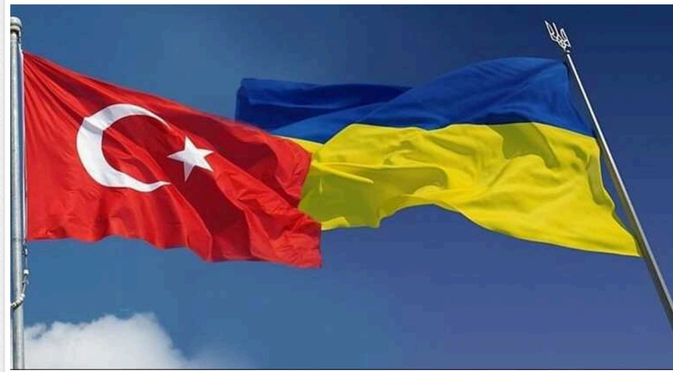
Зеленський: Однієї Туреччини мало для посередництва у перемовинах із РФ

Президенту Туреччини Реджепу Тайїпу Ердогану необхідно зрозуміти, що його країни буде мало для того, щоб відбулись перемовини між Україною та Росією.