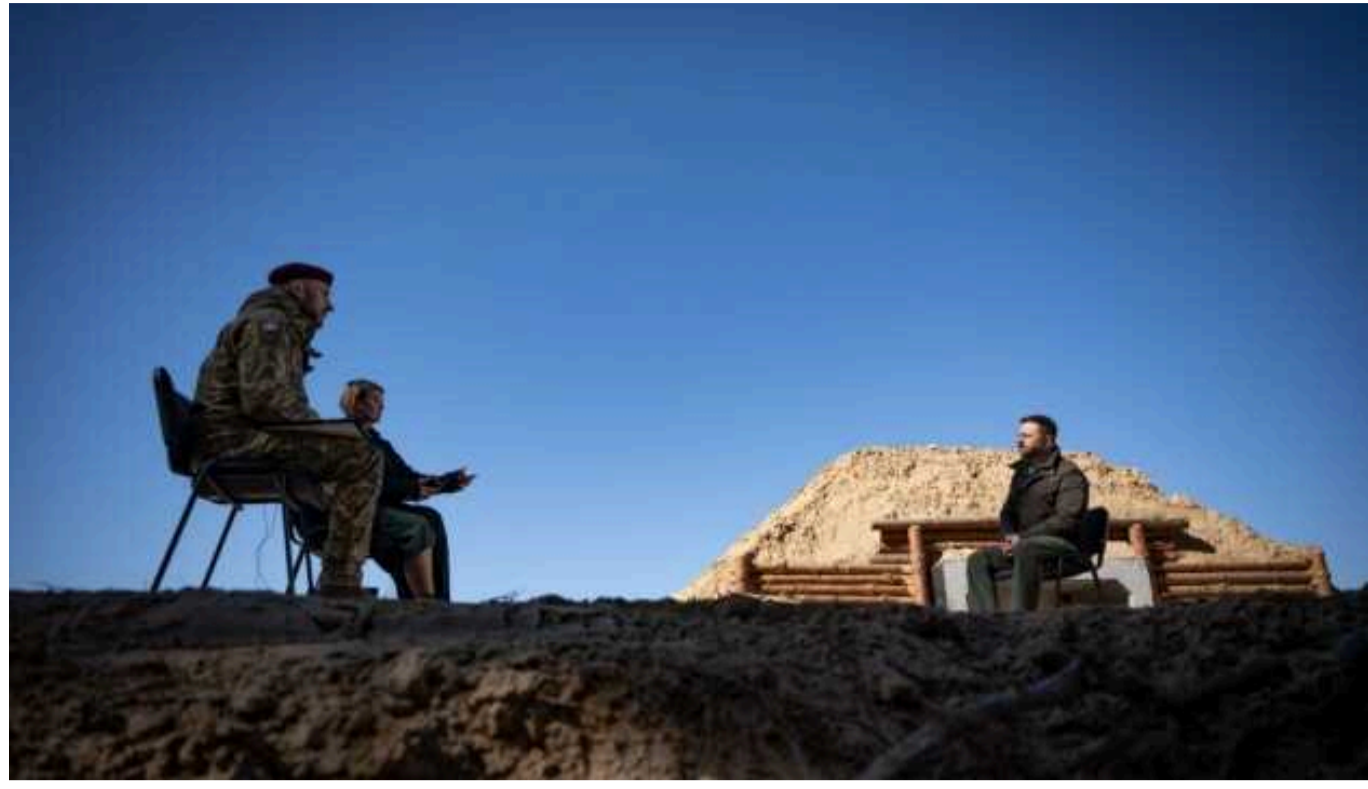
Зеленський: Харків є для росіян бажаною ціллю, але він на сьогодні захищений

Росіяни не приховують, що Харків для них - бажана ціль, але Харків на сьогодні захищений. Україна має потужні лінії оборони, і ворог у разі нападу отримає опір.