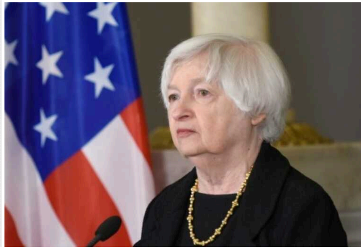
Глава Мінфіну США попередила Пекін про наслідки для китайських компаній за допомогу Росії

Міністерка фінансів США Джанет Єллен на зустрічі з віцепрем'єром уряду КНР Хе Ліфеном у китайському місті Гуанчжоу в суботу попередила його про значні наслідки для компаній із Китаю, якщо вони підтримуватимуть війну Росії проти України.