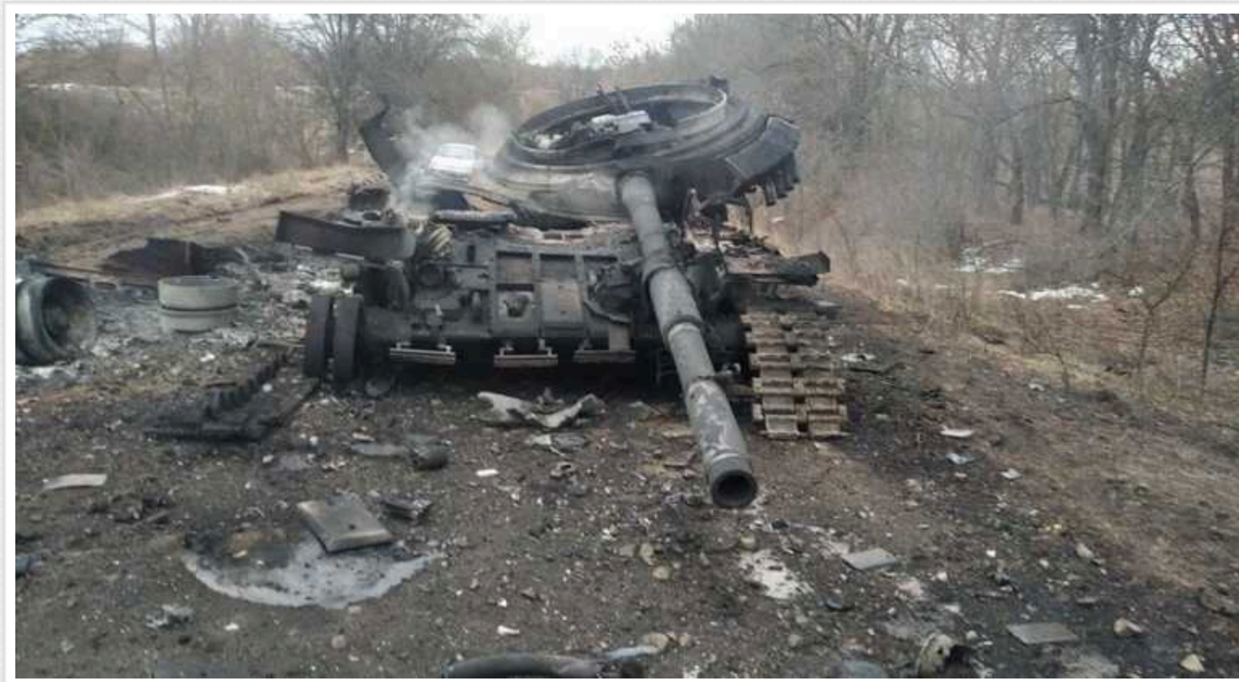
Під Авдіївкою останніми днями була наймасованіша спроба окупантів прорвати оборону, - Генштаб

Січеславські десантники останніми днями відбили наймасованішу спробу Росії прорвати оборону на Авдіївському напрямку. Бої і надалі тривають, а ситуація залишається напруженою.