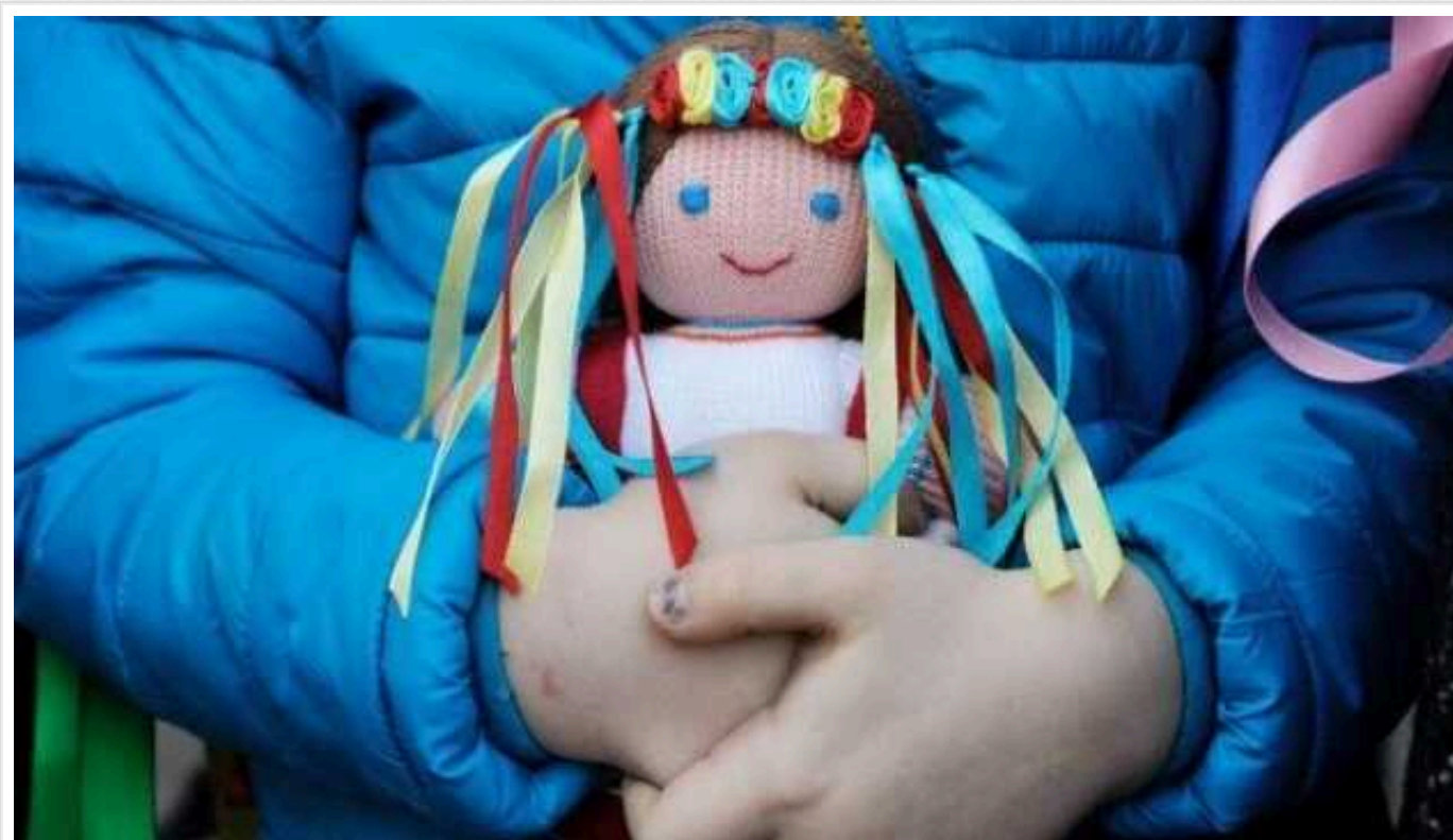
Від початку війни понад 13 тисяч дітей в Україні залишилися без батьківського піклування

Статусу дитини-сироти або дитини, позбавленої батьківського піклування, від початку повномасштабної війни набули понад 13 тисяч дітей.