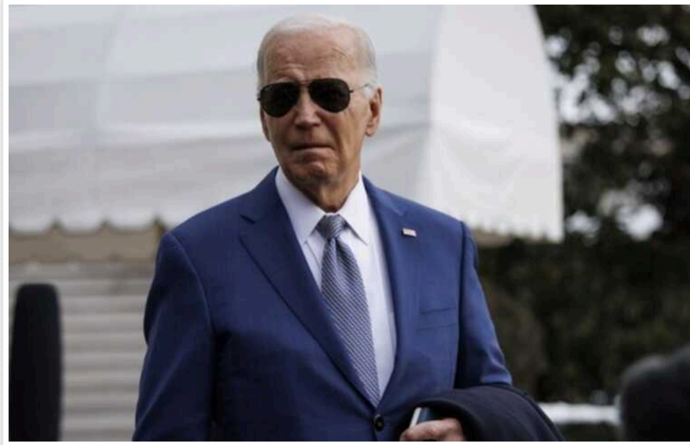
Bloomberg: Байден за березень зібрав 90 мільйонів доларів на виборчу кампанію, випередивши Трампа