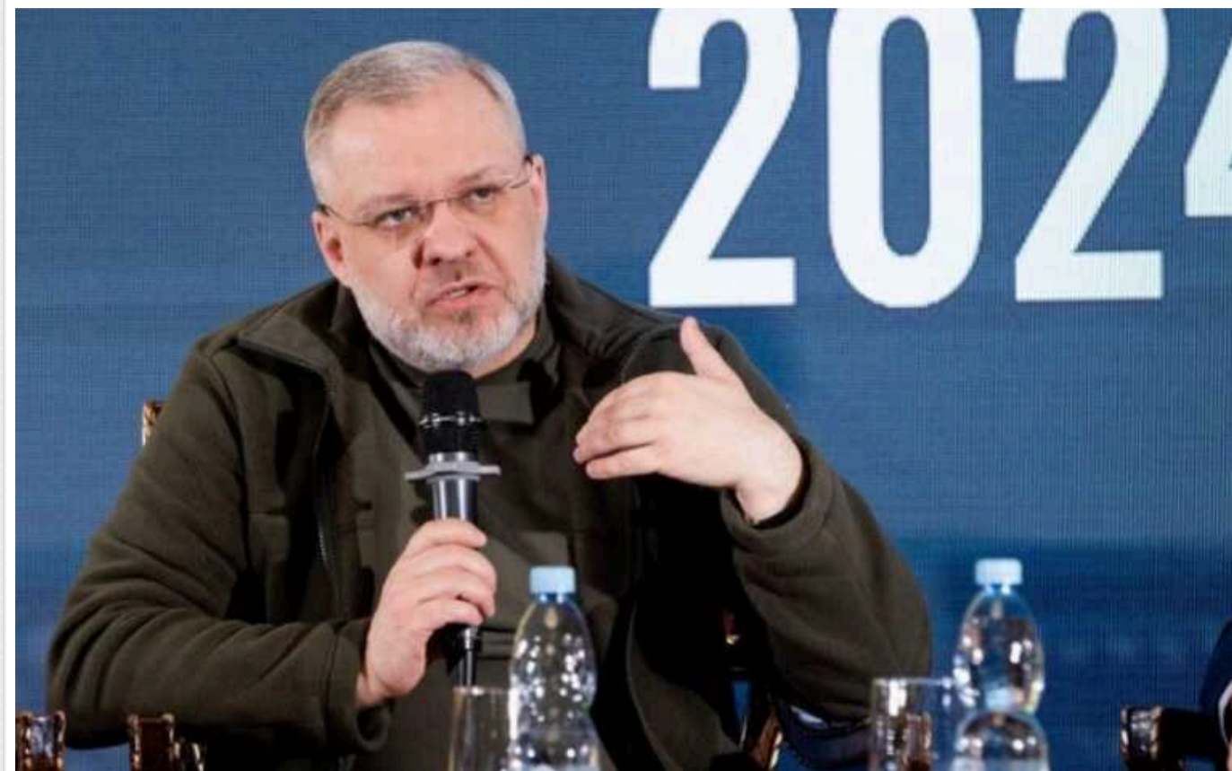
У Міненерго не виключають підвищення тарифів на електроенергію через наслідки ворожих атак

Уряд вивчає різні варіанти фінансування ремонту енергооб'єктів після нових атак росіян, також не виключається підвищення тарифів для населення.