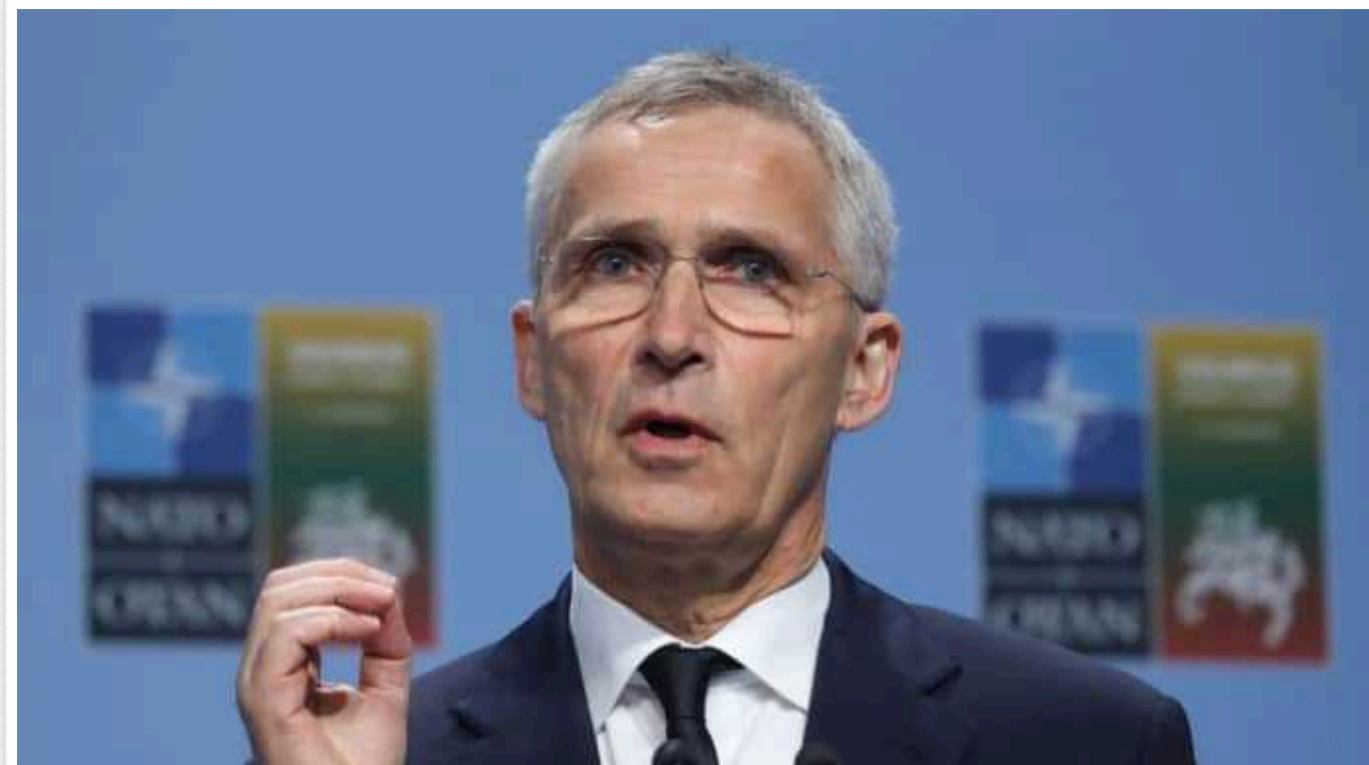
Столтенберг припустив можливість компромісів з боку України у війні з РФ

Генеральний секретар НАТО Єнс Столтенберг припустив, що Україні, можливо, доведеться вирішувати, чи йти на "певні компроміси".