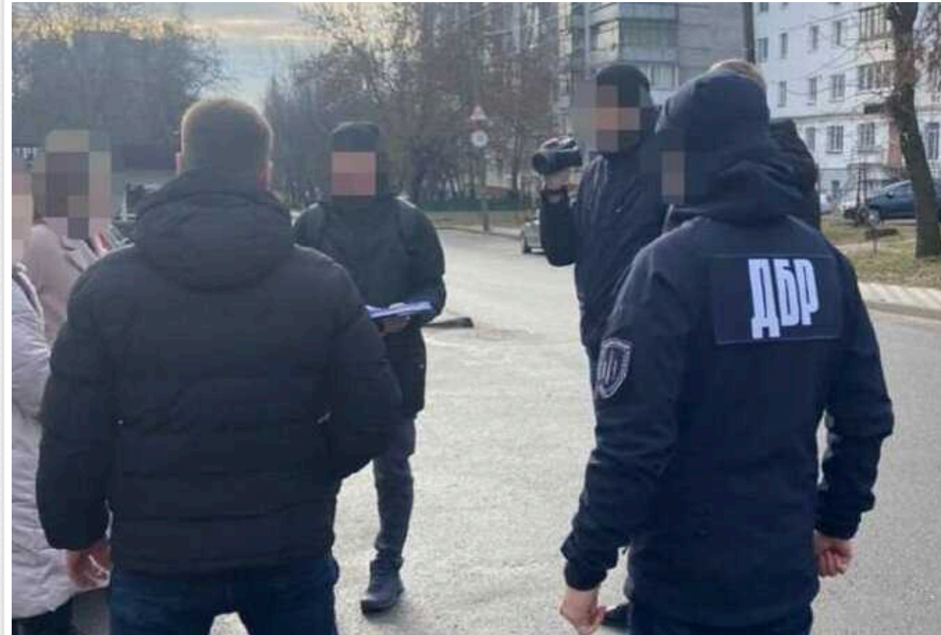
На Житомирщині експравоохоронець привласнив пів мільйона гривень, що були доказами у провадженні

На Житомирщині перед судом постане експравоохоронець, який привласнив пів мільйона гривень, що були доказами у провадженні.