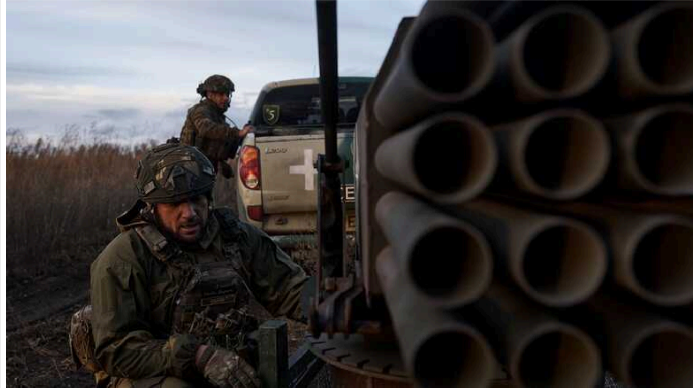
Ситуація на фронті: Протягом минулої доби відбулося 65 бойових зіткнень

На Бахмутському напрямку українськими війнами відбито 30 атак. На Новопавлівському напрямку ворог понад 20 разів намагався прорвати оборону наших військ. Рaketні війська уразили по одному району зосередження особового складу, озброєння та військової техніки окупантів.