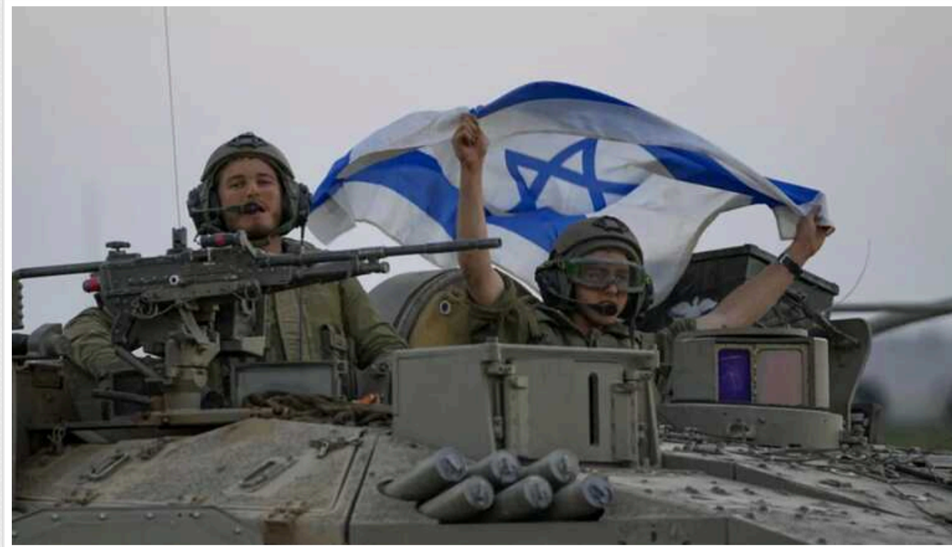
CNN: США перевіряють, чи міг Ізраїль використовувати ШІ для визначення цілей у Секторі Гази

Сполучені Штати вивчають повідомлення про те, що ізраїльські військові використовують штучний інтелект для визначення цілей бомбардувань у Секторі Гази.