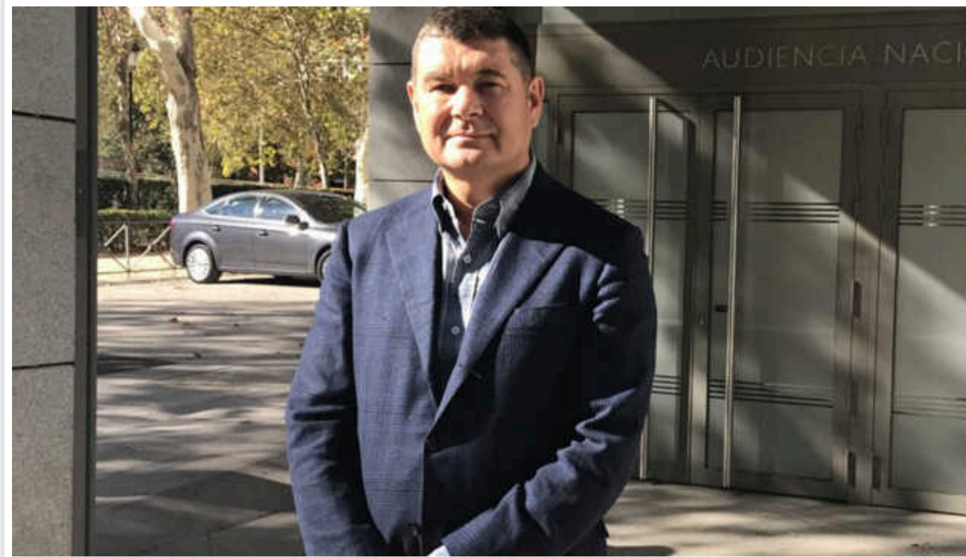
Вищий антикорупційний суд оголосив вирок Онищенко у «газовій справі»

Колегія суддів Вищого антикорупційного суду оголосила вирок народному депутату VII скликання і його фінансовому директору, обвинуваченим у заволодінні понад 740 млн грн під час видобутку та продажу природного газу в рамках договорів про спільну діяльність з публічним акціонерним товариством "Укргазвидобування".