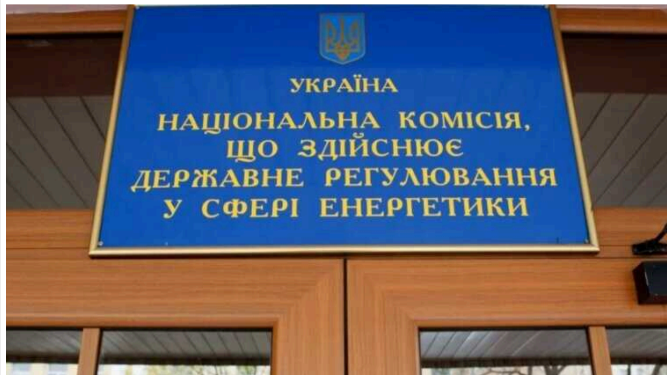
СБУ розслідує участь керівництва НКРЕКП у розкраданні коштів газотранспортної системи України

Схема полягала у тому, що облгази, підконтрольні Фірташу, "купували" паливо у підконтрольної йому ж компанії. Але в реальності отримували не більше 30% від проплатеного обсягу газу.