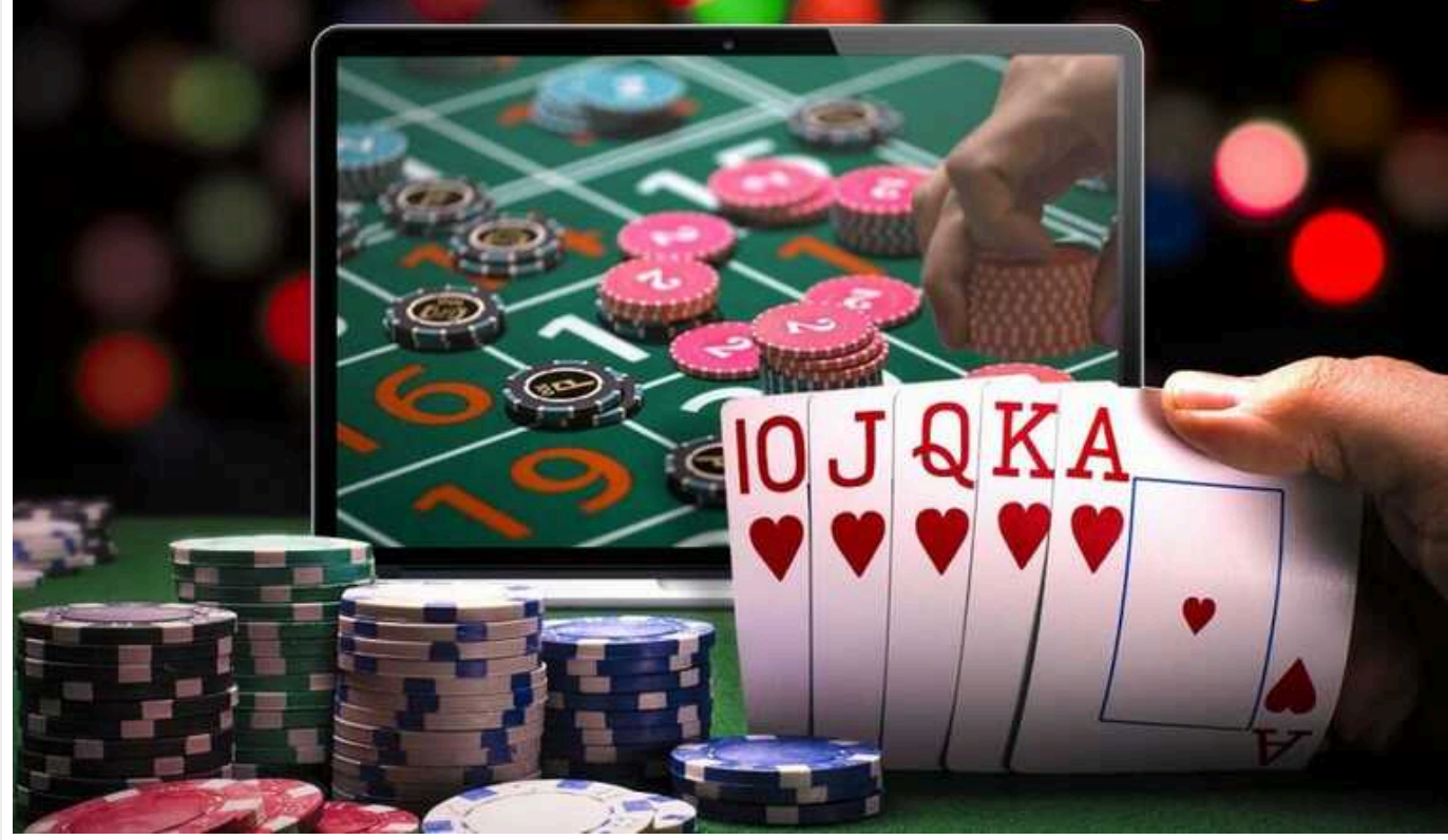
Чому ВР взялася за гральний бізнес і до чого тут військові

Однією з головних тем в Україні останніми днями стала обмеження роботи онлайн-казино. Вона обговорюється у соцмережах, на нїй реагує президент Володимир Зеленський, а профільний комітет Верховної Ради підготував зміни.