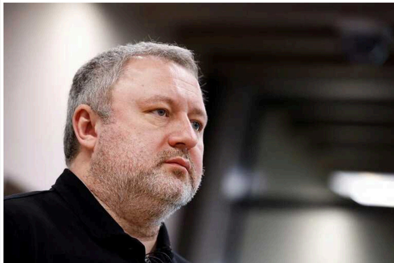
Зеленський ухвалив рішення про звільнення Костіна. Новим генпрокурором може стати очільник Одеської ОВА Кіпер – ЗМІ

Андрія Костіна можуть направити послом у Нідерланди, якщо Амстердам погодиться на пропозицію Києва.