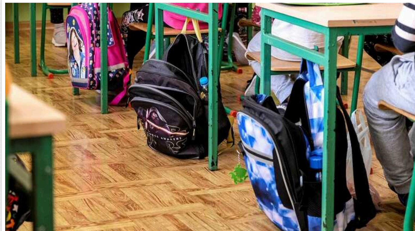
У Польщі українських дітей-біженців зобов'язують іти до місцевих шкіл із 1 вересня

Попередньо відомо, що для українських дітей у польських школах запровадять спеціальні уроки української мови.