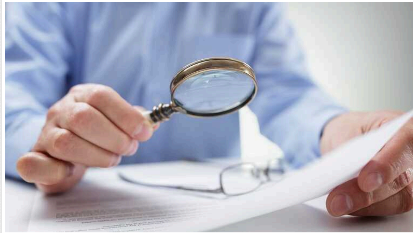
В Україні готують нові податкові правила: затвердили законопроект, який передбачає усунення податкових перевірок для "білого бізнесу"

У податковому комітеті Верховної Ради затвердили законопроект, який передбачає усунення податкових перевірок для т.зв. "білого бізнесу". Тобто для підприємств з високим рівнем добровільного дотримання податкового законодавства.