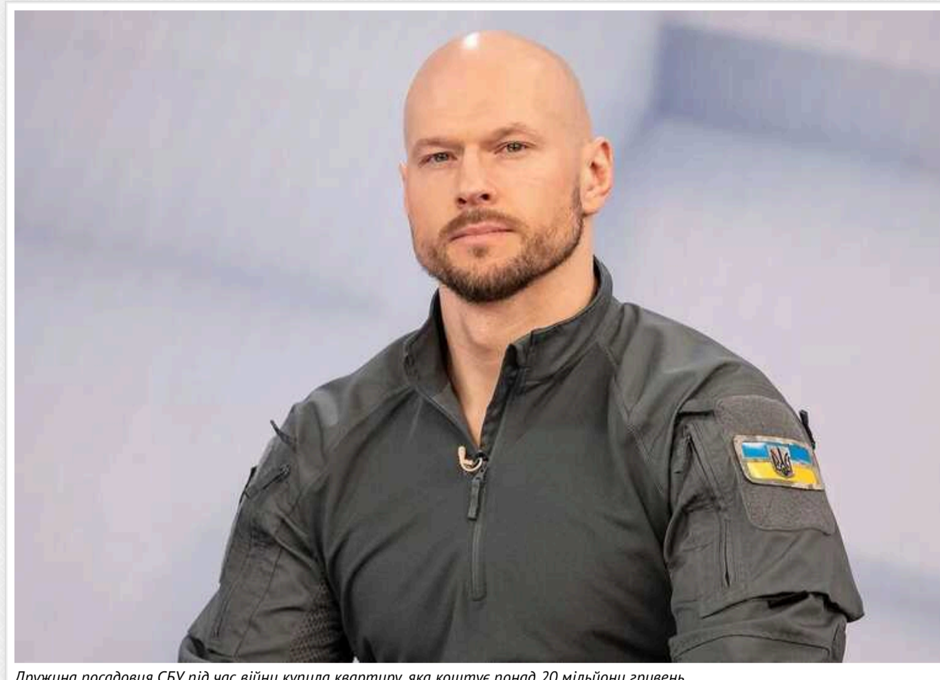
Дружина посадовця СБУ під час війни купила квартиру, яка коштує понад 20 мільйони гривень

У дружини голови департаменту кібербезпеки СБУ Іллі Вітюка Юлії журналісти виявили придбану у грудні 2023 року квартиру, яка за ринковою ціною повинна коштувати понад 20 мільйонів гривень. В декларації бригадного генерала вказано, що за це житло сплатили лише 12,8 мільйонів гривень.