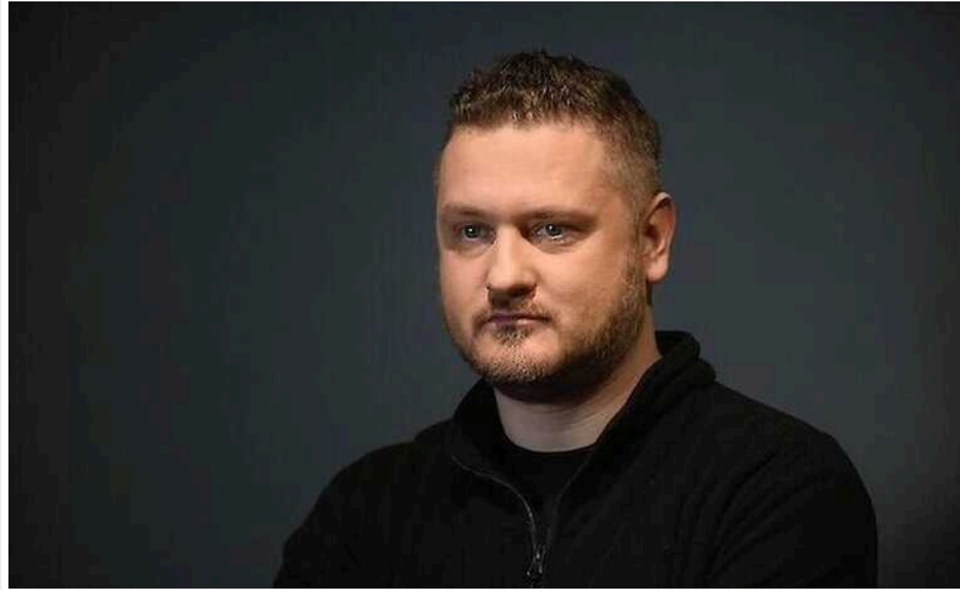
ЗС РФ готують літній наступ, який розпочнеться у травні-червні, але він не буде зосереджений на Харкові, - ЦПД