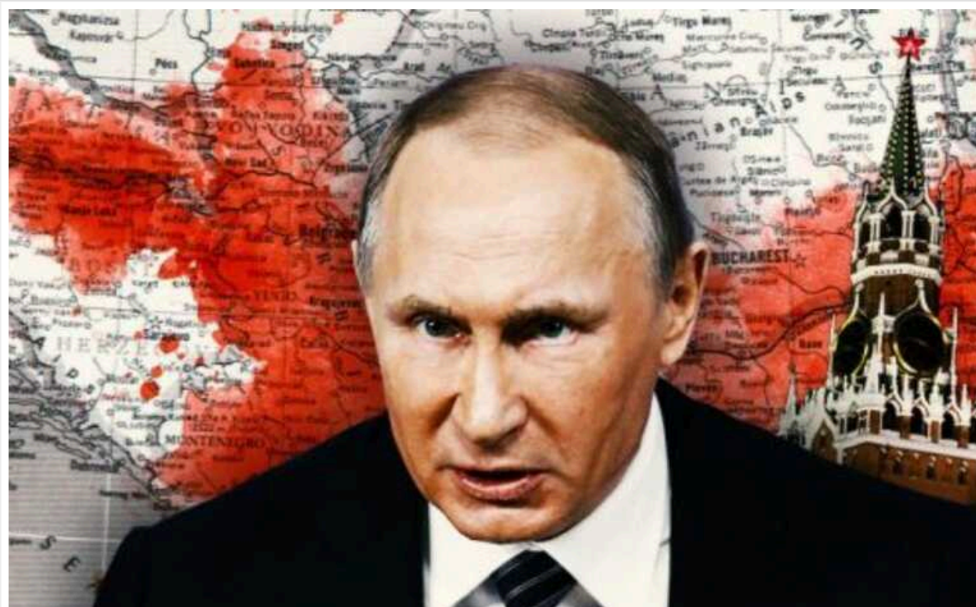
Як Кремль здатен дестабілізувати Західні Балкани для створення другого фронту в Європі

В державах Західних Балкан, які зазнали збройного конфлікту, як Боснія і Герцеговина (БіГ) та Косово, присутня напруга і побоювання через дестабілізацію й можливість нових конфліктів. Навіть у Чорногорії, яка є членом НАТО, існують побоювання щодо кризи, оскільки до уряду мають увійти проросербські та проросійські політичні партії