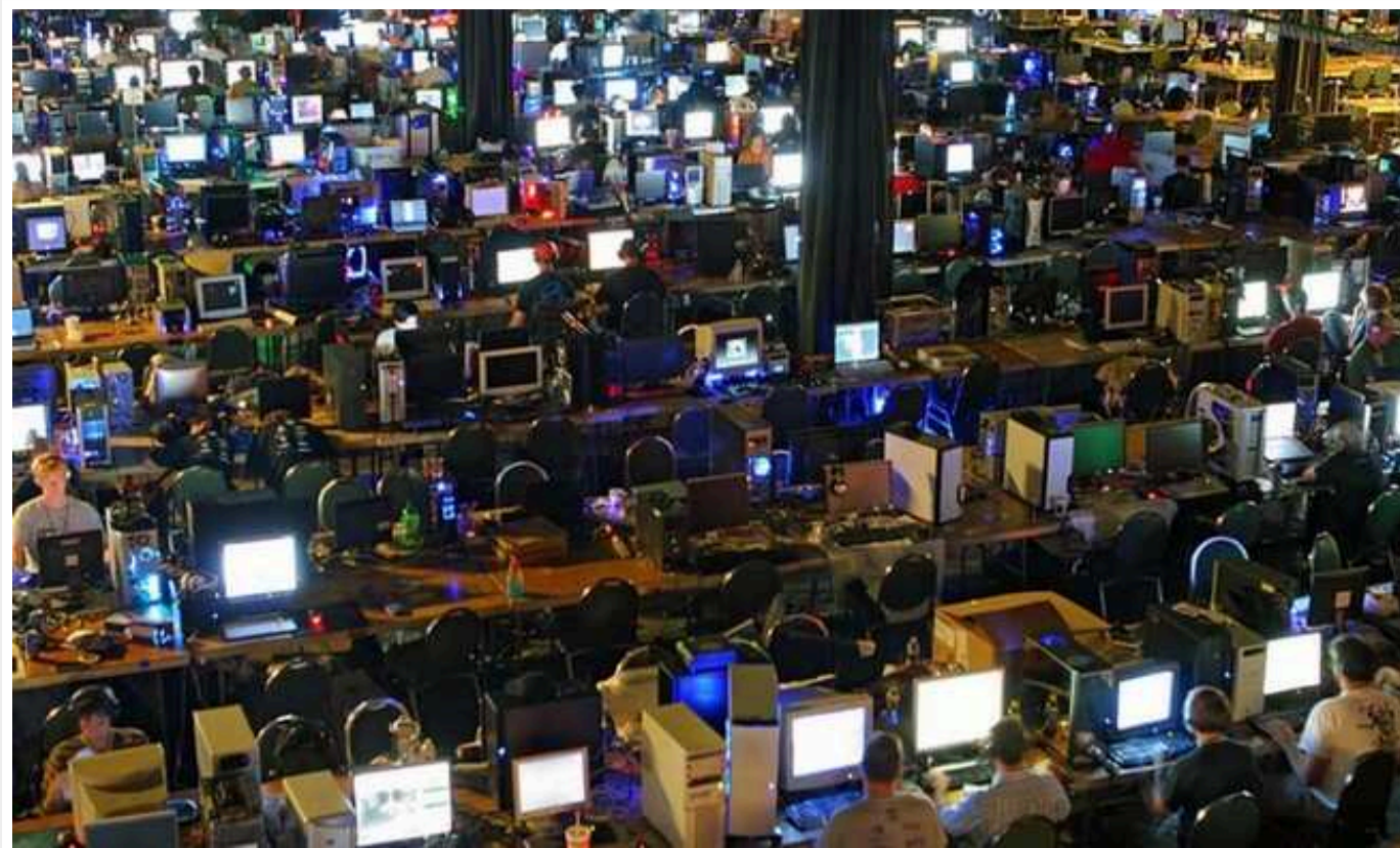
У WSJ розповіли, чим займаються "ферми тролів" Пригожина після його загибелі

Російські "ферми тролів", пов'язані із загиблим ватажком ПВК "Вагнер" Євгенієм Пригожиним, залишаються активними через кілька місяців після його смерті в авіакатастрофі. Імовірно, вони продовжать поширювати дезінформацію, щоб вплинути на думку про війну РФ проти України та вибори в США в 2024 році.