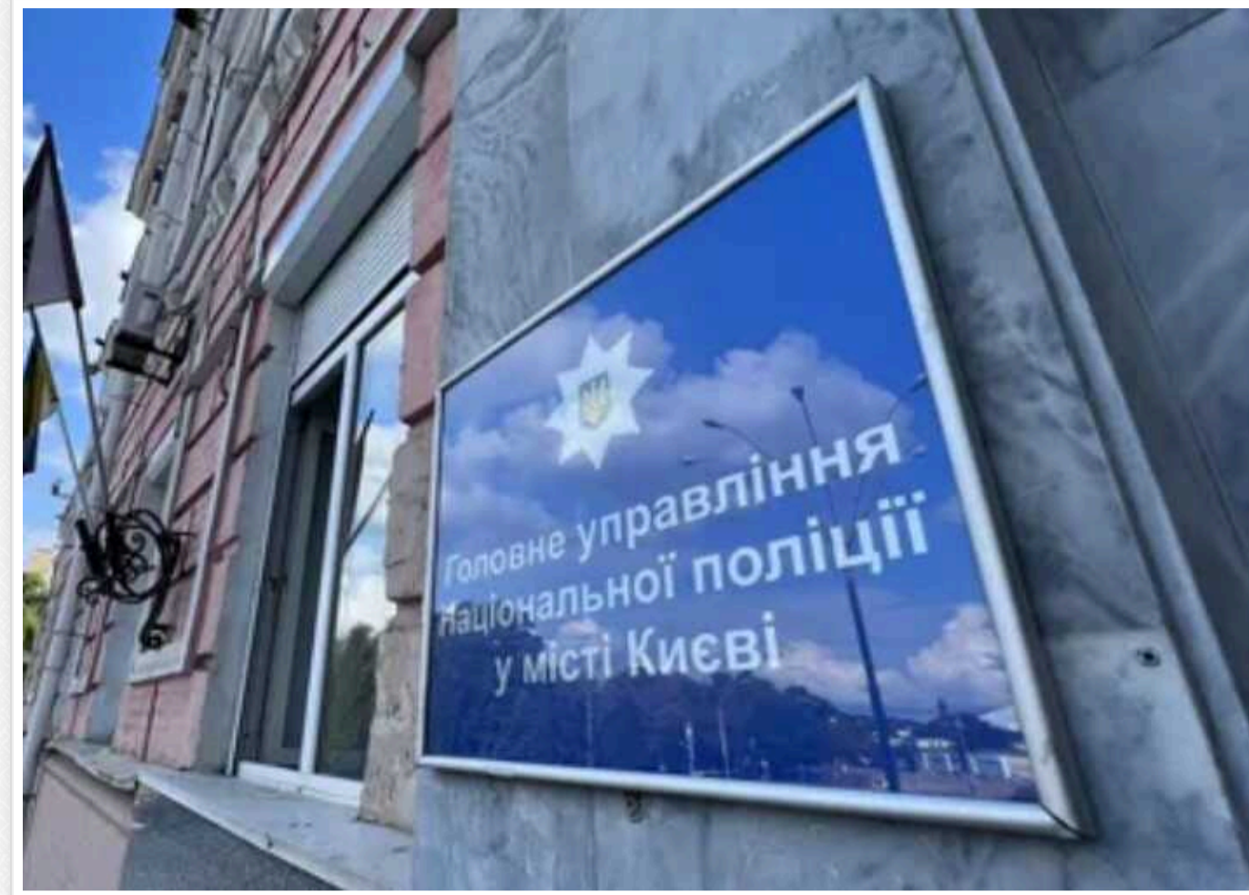
У Києві поліцейські затримали зловмисника, який продавав наркотики зі свого вікна

У Дніпровському районі Києва викрили чоловіка, який, за даними слідства, продавав наркотики прямо з вікна власної квартири. Під час обшуку у зловмисника знайшли та вилучили 79 зіп-пакетів з канабісом, що були готові до збуту.