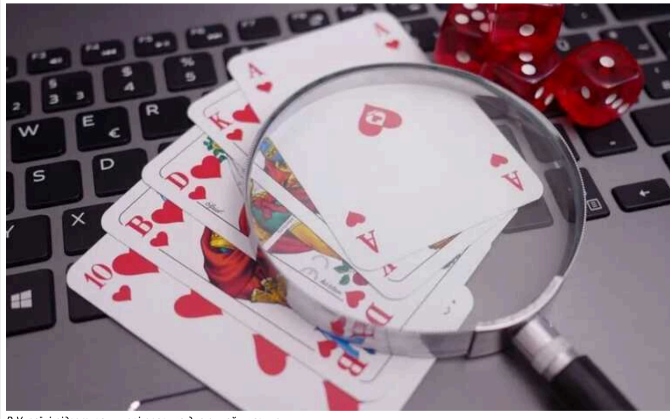
В Україні підготували нові правила для онлайн-казино

У Верховній Раді мають намір посилити контроль за гральним бізнесом – зокрема, суттєво обмежити рекламу, дозволити блокування причетних до азартних ігор сайтів і виставити окремі вимоги до банків. Відповідний законопроект схвалив парламентський Комітетом з питань фінансів, податкової та митної політики.