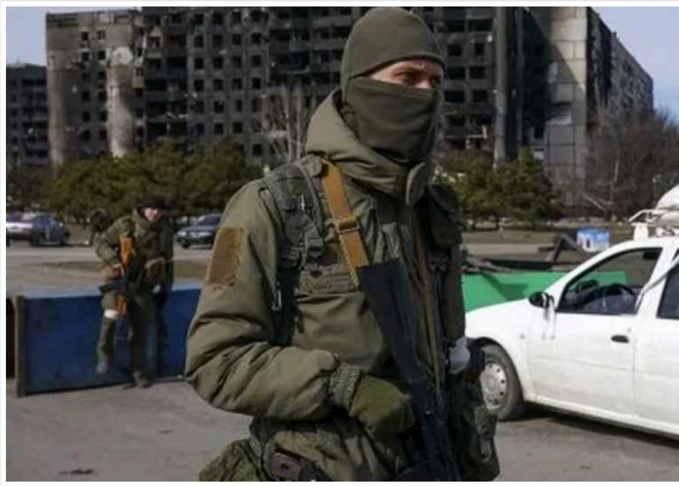
Окупанти вирішили "націоналізувати" житло українців в окупації

На тимчасово окупованих територіях України російські загарбники задумали "офіційно" закріпити те, що вже йде повним ходом, – "віджимання" квартир і будинків українців. Причому "нова влада" переконує, що тепер "усе буде за законом".