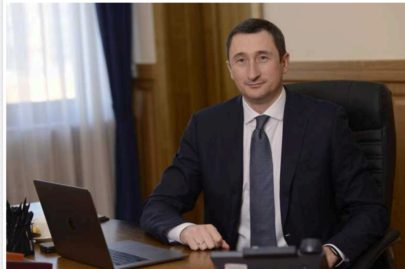
Глава "Нафтогазу" задекларував космічну зарплату. Навіть прем'єр отримує у 10 разів менше

Прем'єр-міністр України Денис Шмигаль отримує зарплату у 22 рази меншу, ніж глава "Нафтогазу" Олексій Чернишов. Шмигаль задекларував зарплату у розмірі 81 237 грн. Тоді як голова "Нафтогазу" отримує 1,7 млн грн на місяць.