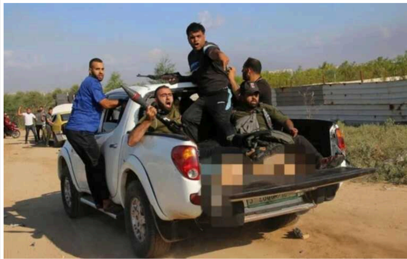
Скандал на Pictures of the Year: фото Associated Press з бойовиками ХАМАСу, які везуть тіло вбитої жінки викликало обурення у світі

Престижна фотопремія Pictures of the Year присудила агентству Associated Press нагороду "Командна фотоісторія року" за знімок бойовиків ХАМАСу, які везуть тіло вбитої дівчини до Гази.