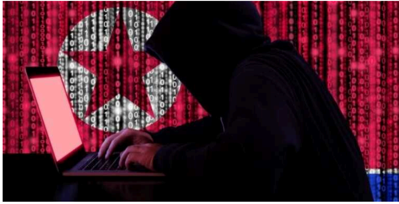
Україна не є пріоритетом для хакерів КНДР та Китаю. У них інший орієнтир, – СБУ

Ані для хакерів Китаю, ані для Північної Кореї Україна не є пріоритетом, тому в них немає інтересу робити щось серйозне у нас, у них інший орієнтир.