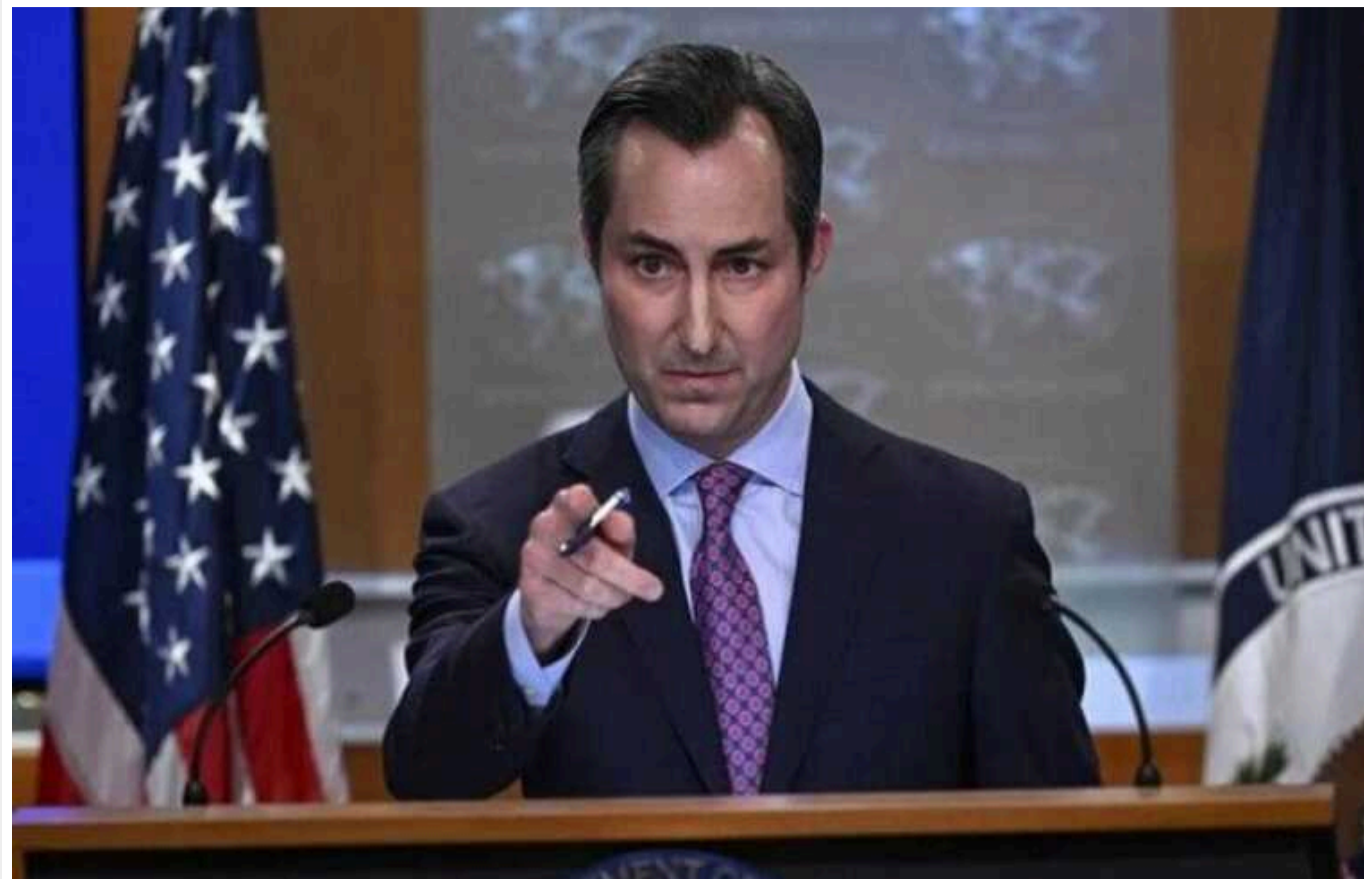
Сполучені Штати не підтримують членство Палестини в ООН

Сполучені Штати Америки прагнуть, щоб створення незалежної палестинської держави відбулося шляхом прямих переговорів з Ізраїлем, а не через вступ Палестини в ООН.