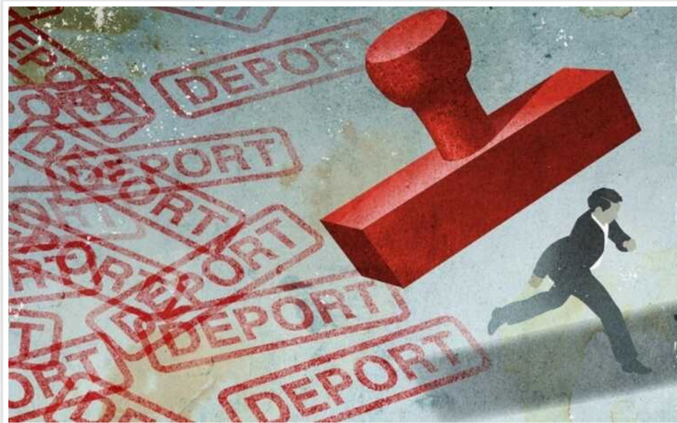
ЄС за минулий рік депортував понад 7000 росіян

У 2023 році країни Євросоюзу вислали зі своєї території понад 7 тисяч росіян. Йдеться про ті випадки, коли громадяни РФ незаконно потрапили на територію країн блоку або ж заїхали легально, але потім порушили правила перебування.