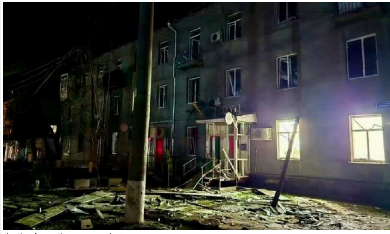
Наслідки удару по Харкову: зросла кількість жертв