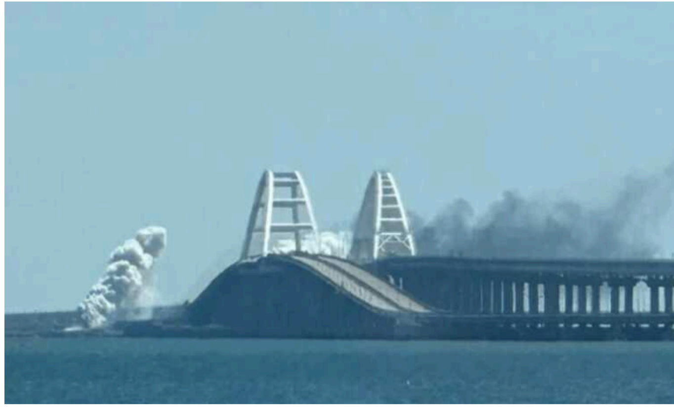
У ГУР відреагували на заяві ЗМІ про нові удари по Кримському мосту

Представник ГУР зауважив, що у західних медіа останнім часом публікується багато матеріалів з гучними заголовками і посиланнями на анонімні джерела, коментувати які не завжди доречно.