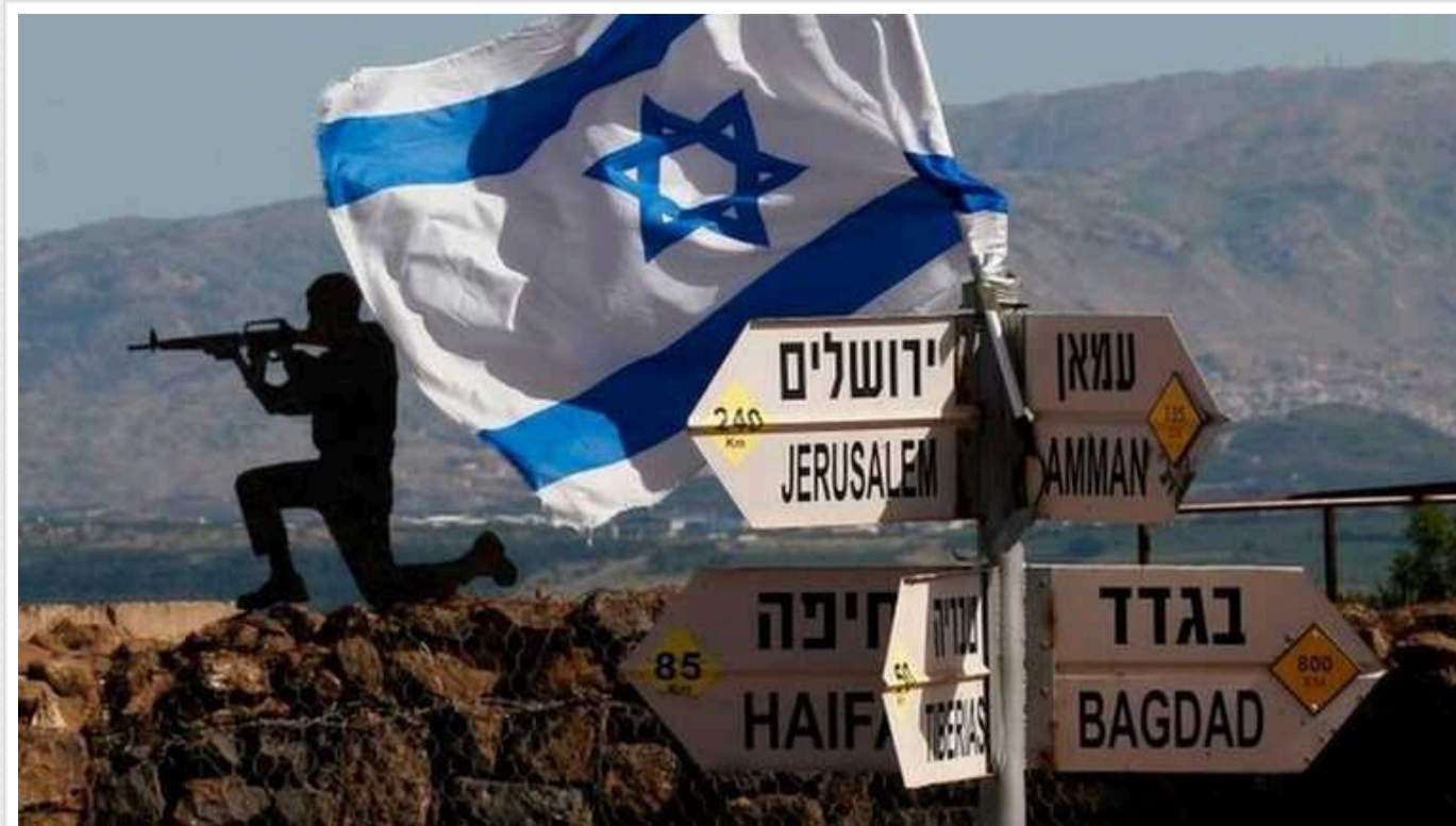
Іран може нападати на Ізраїль протягом 48 годин, – ЗМІ