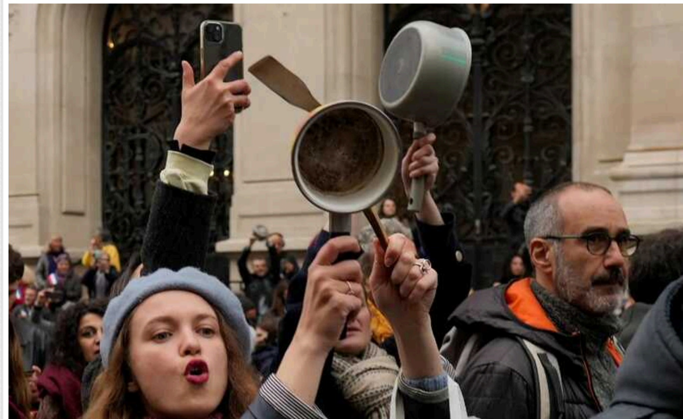
Російська опозиція готує "Марш порожніх каструль"

Російський рух дружин мобілізованих на війну в Україні "Шлях додому" анонсував на 6 квітня проведення по всій країні "Марш порожніх каструль". Хоча у назві вживається слово "марш", насправді організатори акції виходити на вулиці не пропонують. Натомість вони кажуть про "безпечну акцію протесту".