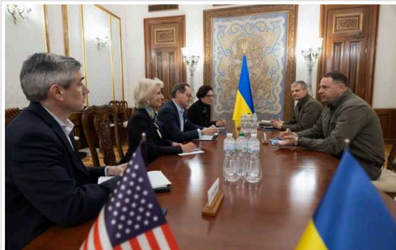
В Україну прибула американська делегація, яка відповідає за оборонну стратегію

До України у середу, 3 квітня, прибули представники Комісії з питань Національної оборонної стратегії Сполучених Штатів Америки.