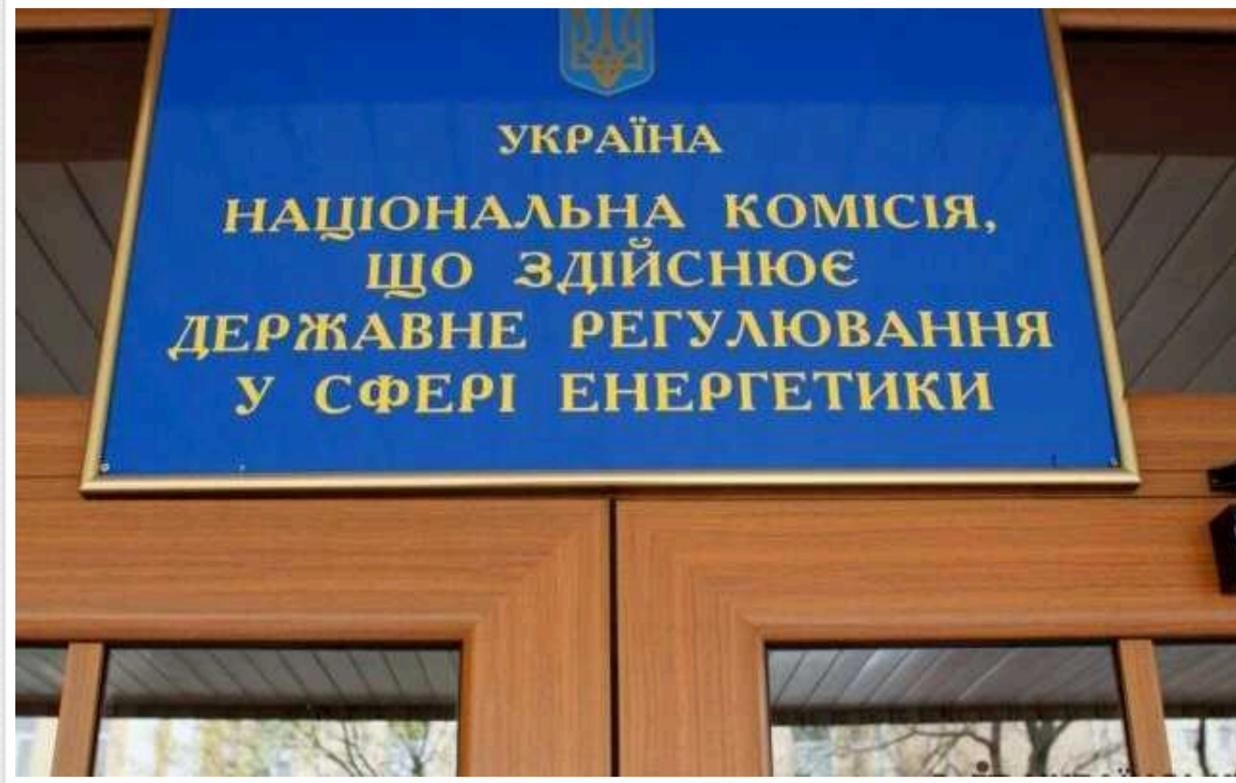
У НКРЕКП спростовують інформацію про збільшення тарифів на електрику у травні