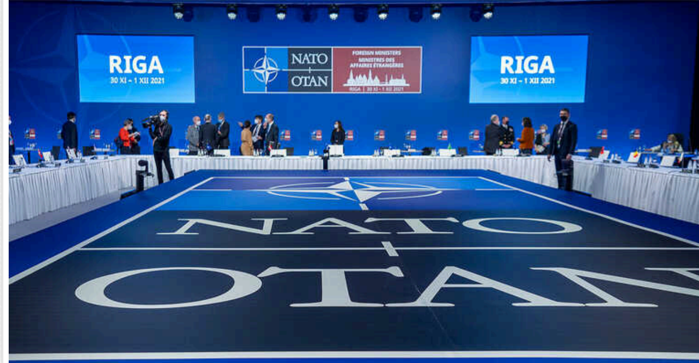
Пропозиції НАТО перевести "Рамштайн" під інший формат стикається з низкою перешкод

Про це повідомляє The New York Times із посиланням на джерела.