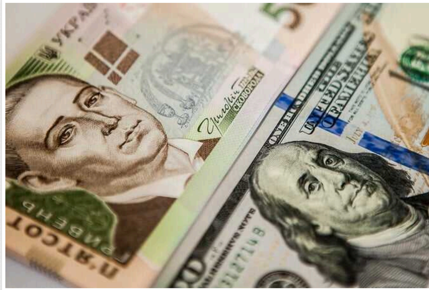
Гривня продовжує падіння, а державний борг за березень різко зріс

На завтра НБУ встановив новий офіційний курс гривні до долара та євро, який є черговим найнижчим для національної валюти: