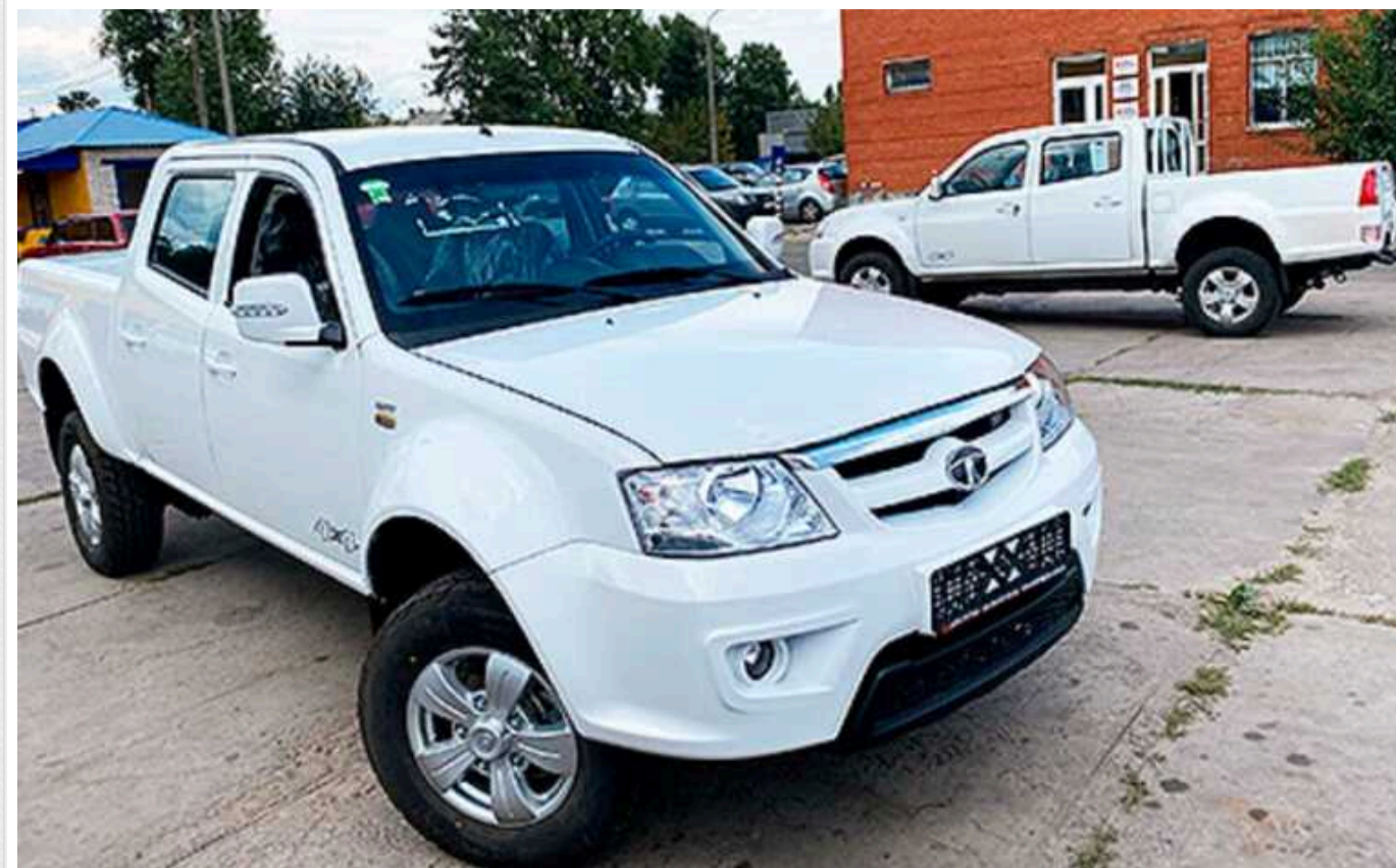
«Оператор ГТС» за 83 мільйони замовив індійські пікапи дешевше навіть від китайських

ТОВ «Оператор газотранспортної системи України» 22 березня за результатами тендеру уклало угоду з ТОВ «Авто-Регіон» про постачання автомобілів на 82,64 млн грн (тут і далі ціни та суми вказано з урахуванням ПДВ).