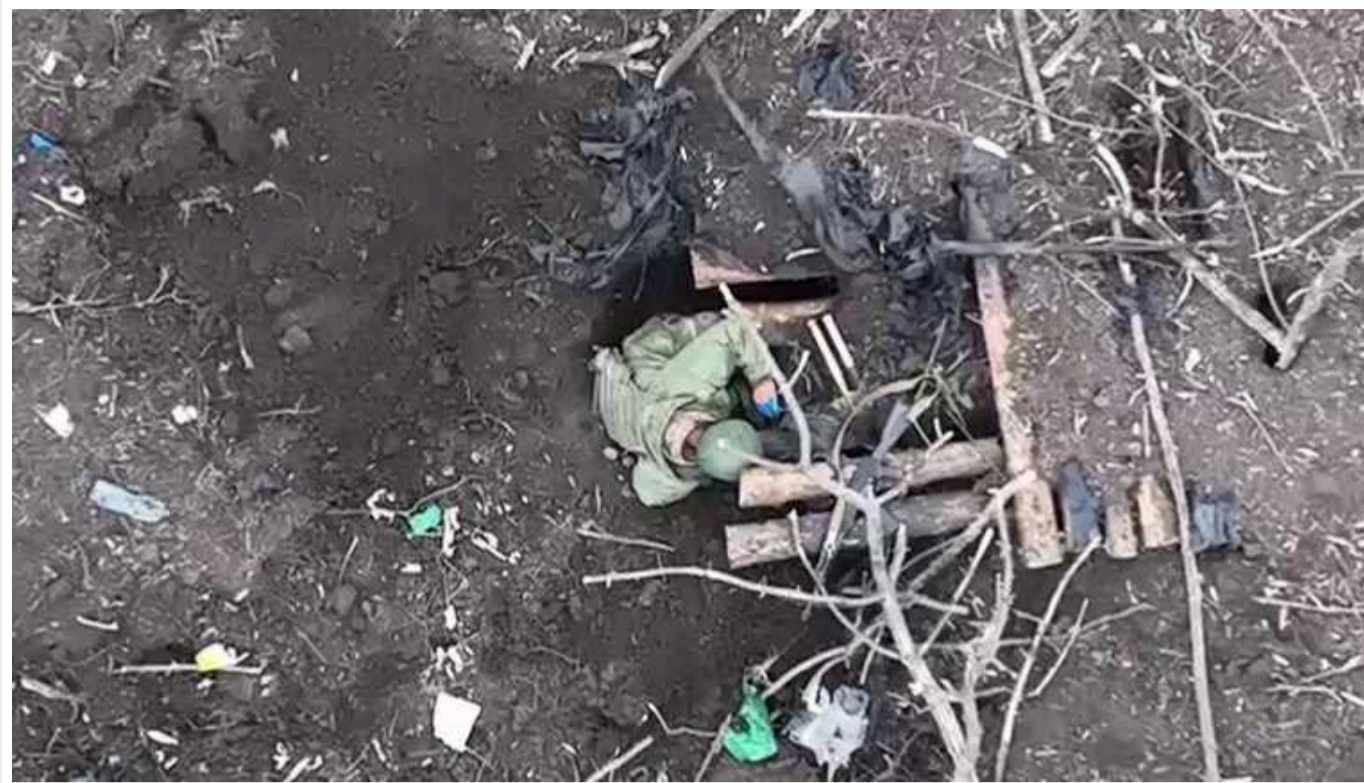
Українські бійці показали ліквідацію російської піхоти поблизу Тернів