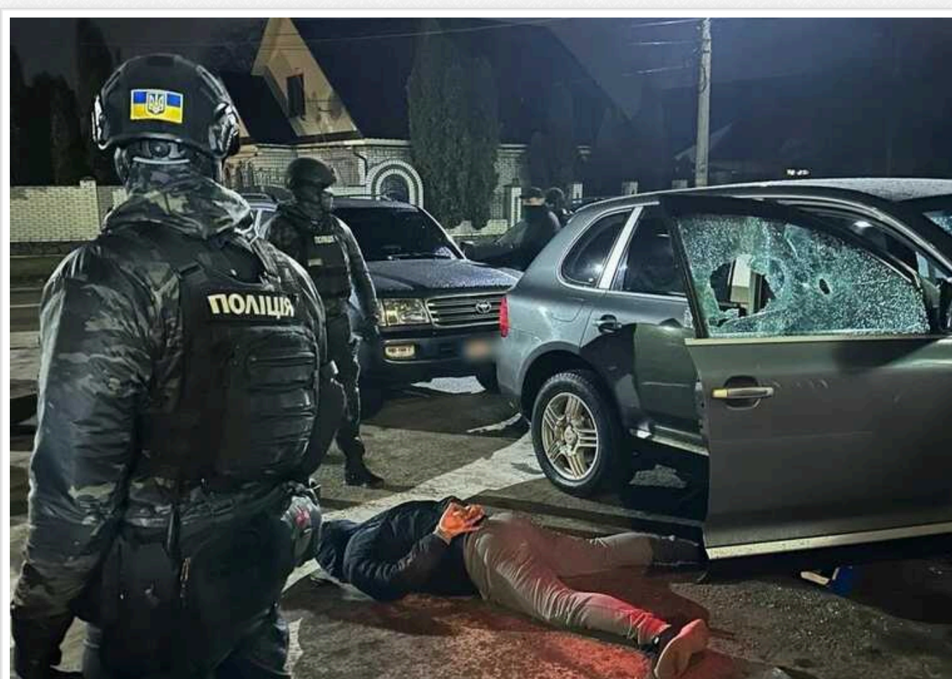
ЗМІ розповіли подробиці справи про замах на вбивство судді в Умані

За версією поліції, в Умані Черкаської області кримінальний авторитет із помічником намагалися "прибрати" суддю. 19 березня їх затримали із гранатами та пістолетом, зазначає видання «Судовий репортер».