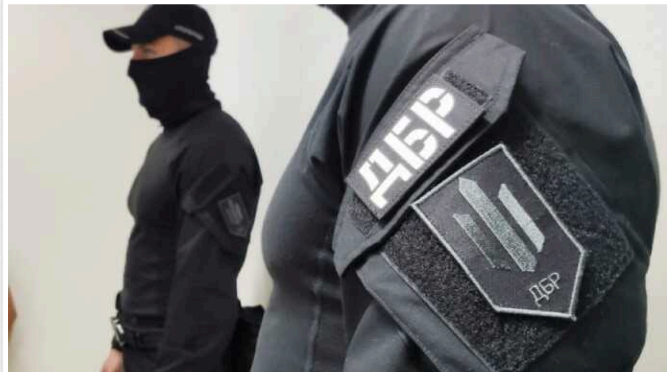
За матеріалами ДБР судитимуть військового посадовця з Харківщини, який заробляв на своїх підлеглих

Працівники ДБР завершили досудове розслідування щодо начальника групи персоналу батальйону однієї з бригад ТРО Харківської області. Він брав гроші у бійців за надання допомоги у розв'язанні їхніх проблем по службі.