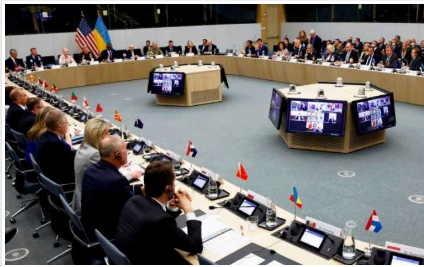
Politico: Формат "Рамштайн" хочуть передати під контроль НАТО

Контактну групу з оборони України (формат "Рамштайн") може очолити Північноатлантичний альянс замість США. Таких заходів хочуть вжити на тлі можливого президентства Дональда Трампа.