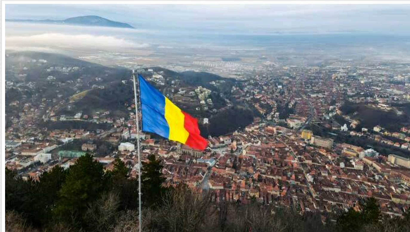
У Румунії хочуть узаконити військову інтервенцію

Міноборони Румунії пропонує своїм громадянам обговорити закон про національну оборону країни. Новий закон передбачає концепцію гібридних загроз безпеці Румунії.