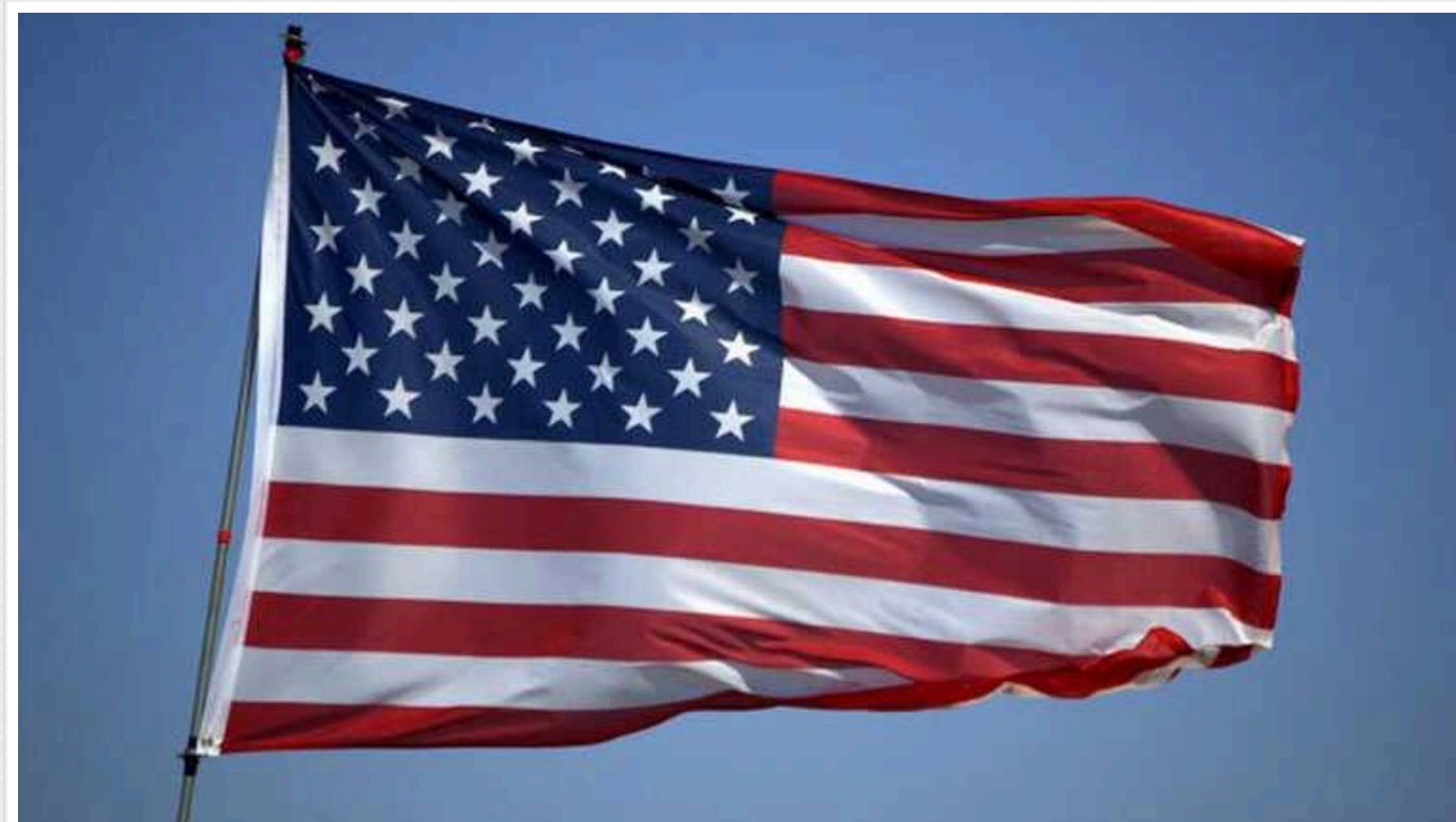
Сполучені Штати не вважають, що між країнами НАТО та РФ назріває збройний конфлікт

Про це заявила постійна представниця США при Альянсі Джуліан Сміт.