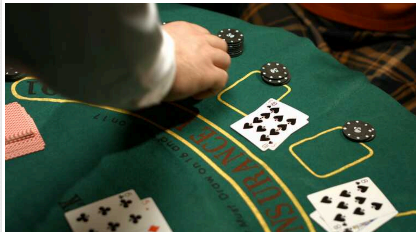
Бізнесмени у сфері грального бізнесу України вказали невеликі доходи від діяльності

Компанії, які займаються організацією грального бізнесу і мають відповідні ліцензії Комісії з регулювання азартних ігор і лотерей (КРАІЛ), у 2023 році показали лише 53 млрд гривень доходу. Чистий прибуток компаній після сплати податків і здійснення всіх адміністративних витрат становить 6,9 млрд гривень.