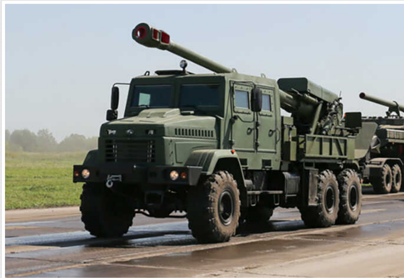
NYT: Український ОПК щомісяця виробляє по 8 САУ "Богдана"

Виробництво українських САУ "Богдана" виросло до 8 одиниць на місяць. Раніше ця кількість сягала 6 одиниць.